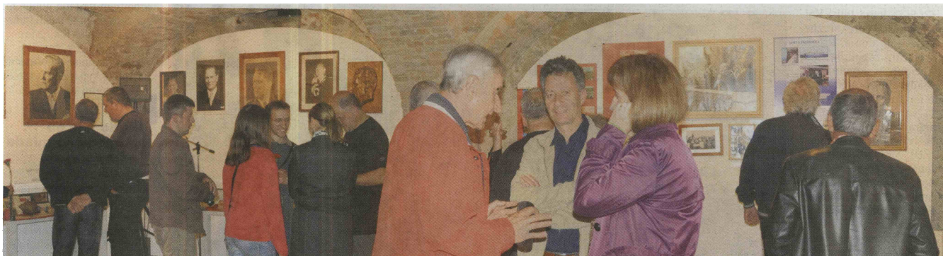
Razstava je privabila številne obiskovalce.