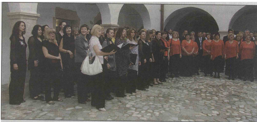
Na letošnji Pesmi Posavja je zapelo 34 pevskih zasedb.