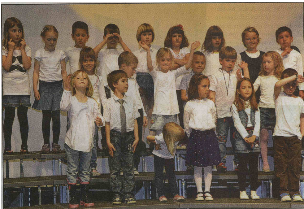
Pevski zborček iz enote velenjskega vrtca Enci benci je, tako kot tudi vsi ostali, navdušil s prisrčnostjo in petjem.