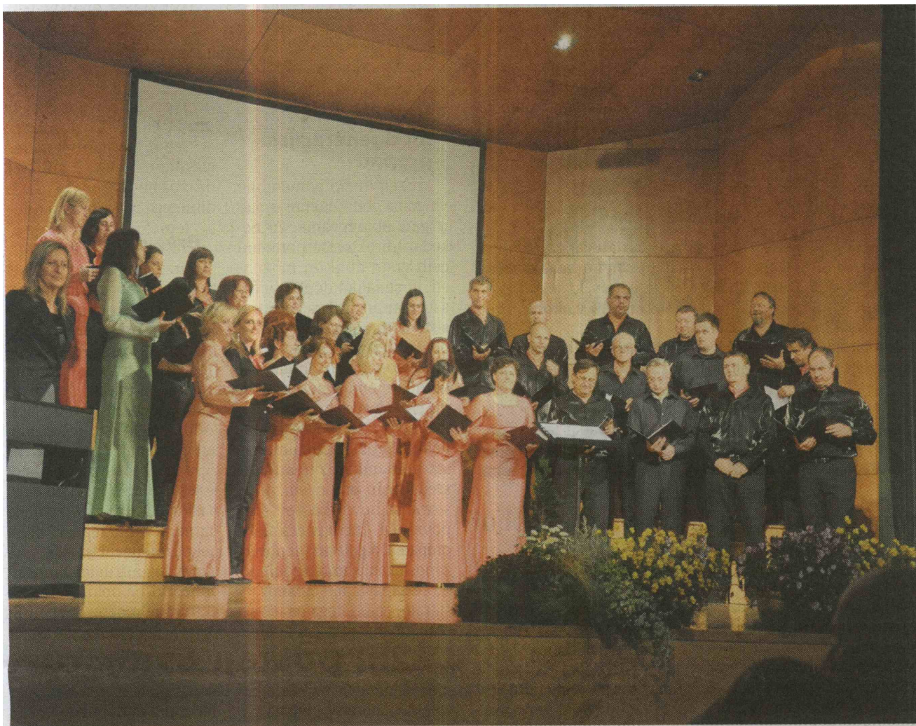
APZ Celje bo v soboto ob 19.30 nastopil na letnem koncertu v celjskem Narodnem domu.