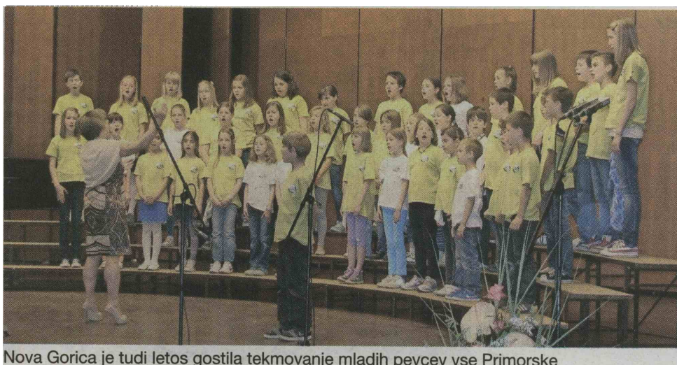
Nova Gorica je tudi letos gostila tekmovanje mladih pevcev vse Primorske

Hkrati je žirija dodelila kopico posebnih priznanj, od dveh za najboljša zbora do tekmovanja do priznanje za najboljšo izvedbo, za najboljšo izbiro sporeda, najboljši zbor, ki je prvič tekmoval na tej preizkušnji in druga. NR