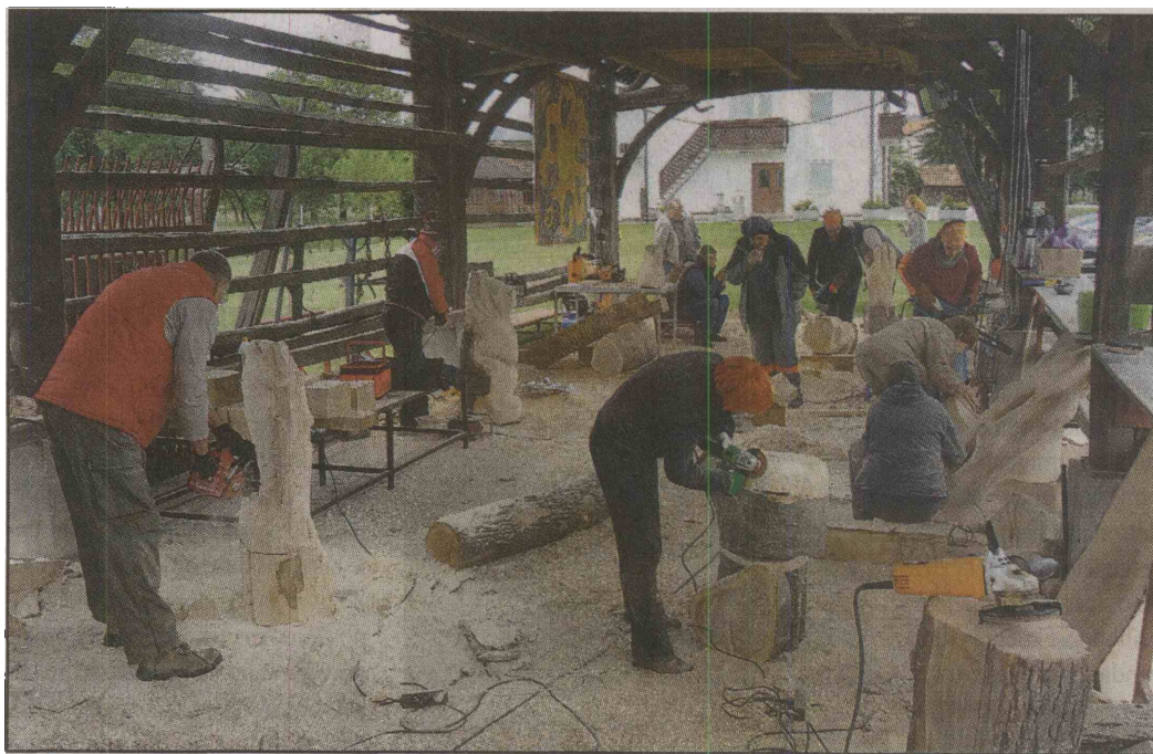
Za ustvarjalni vikend so pod kozolcem poskrbeli udeleženci kiparske delavnice Les .

Čeprav so takšne delavnice v svetu trend, je šmarška še vedno edina tovrstna v Sloveniji in tudi širše, ki in ker je organizirana in vodena.