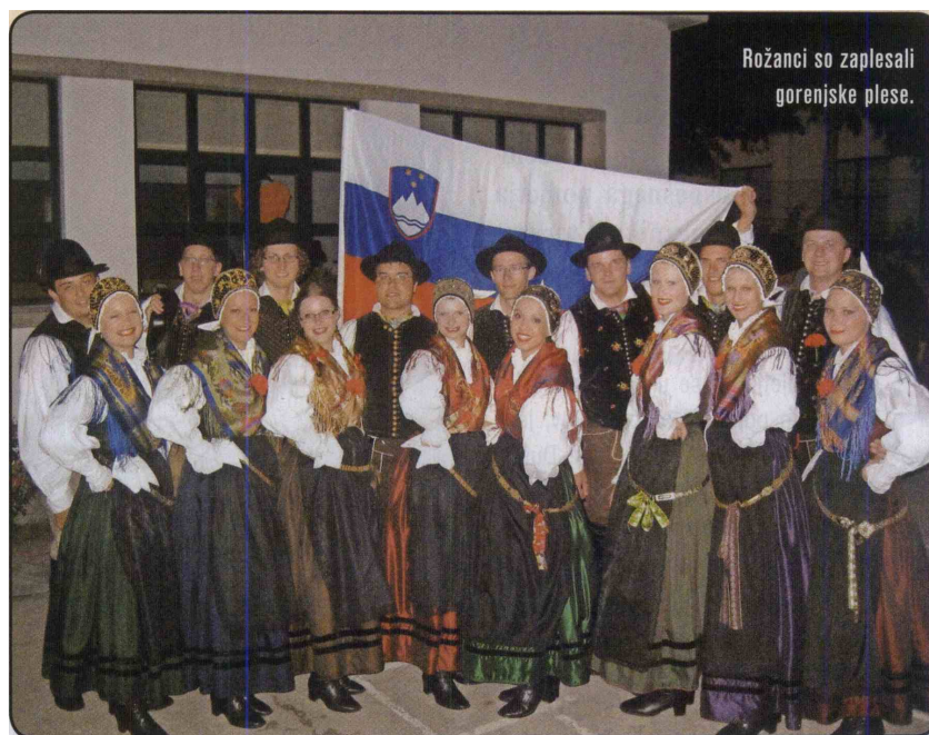
Rožanci so zaplesali gorenjske plesse.

Folklorna skupina Tine Rožanc deluje izključno ljubiteljsko, neprofitno. Vse funkcije v skupini so volonterske. Svoje delovanje