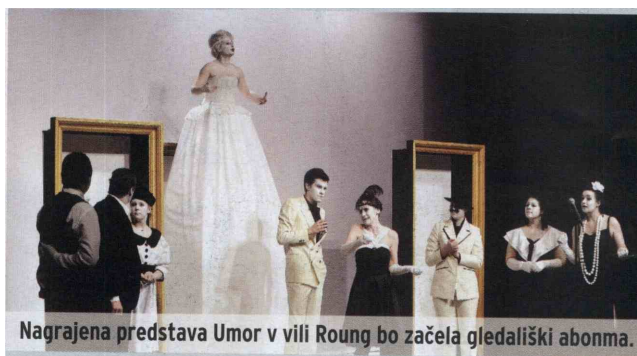
Nagrajena predstava Umor v vili Roung bo začela gledališki abonma.

KPD Planina spet z gledališkim abonmajem