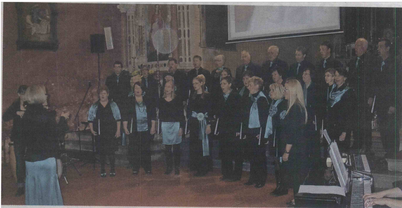
Nastop CeMPZ Zvon pred prezbiterijem župne cerkve sv. Petra