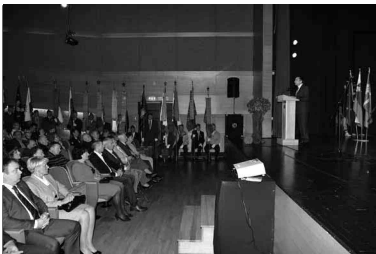
OBČINA KOBARID JE V LETOŠNJEM LETU GOSTILA KAR NEKAJ POMEMBNIH PRIREDITEV, s katerimi so se spominjali različnih dogodkov. Tu se je obeležil evropski dan spomina na žrtve vseh totalitarnih avtoritativnih režimov, pa 70-letnica od ustanovitve Kobariške republike itd.

Zelo sem vesela nove Zgodovinske poti Idrsko in Kolesarske poti Idrsko , ki je speljana od Idrskega do čistilne naprave, mimo kobariške mlekarne in nato po levi strani naše smaragdne lepote do Tolmina. Velika pridobitev za našo občino pa so tudi druge poti: Gamsova krožna pot , Kolesarska pot Kobarid Robič in Tematska pot Kobaridsko blato , ki je speljana od Kobarida do sv. Volarja ter kmalu na začetku vključuje tudi opazovalnico ptic. Tudi številne nove poti v Breginjskem kotu povezujejo našo prečudovito Nadiško dolino z občinama