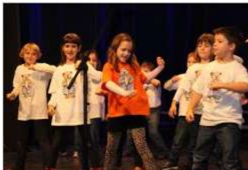
Nastop topliških šolarjev.

Na prireditvi so nastopili učenci drugega razreda, oba šolska pevski zbora, mešani pevski zbor Dolenjske Toplice in folklorna skupina topliškega društva podeželskih žena.