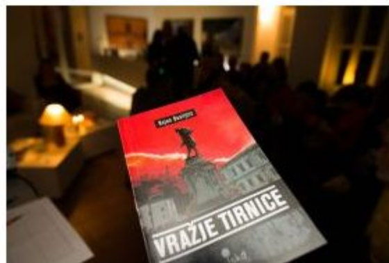
Roman Vražje tirnice , ki je v Srbiji doživel velik uspeh in je bil ponatisnjen, lahko v slovenskem prevodu prebiramo 18 let po izdaji izvirnika.

” Vedno sem verjel, da so čustva brezčasná. Nikoli nisem mislil, da je moja največja vrednota tisto, kar vem, ampak tisto, kar čutim. “