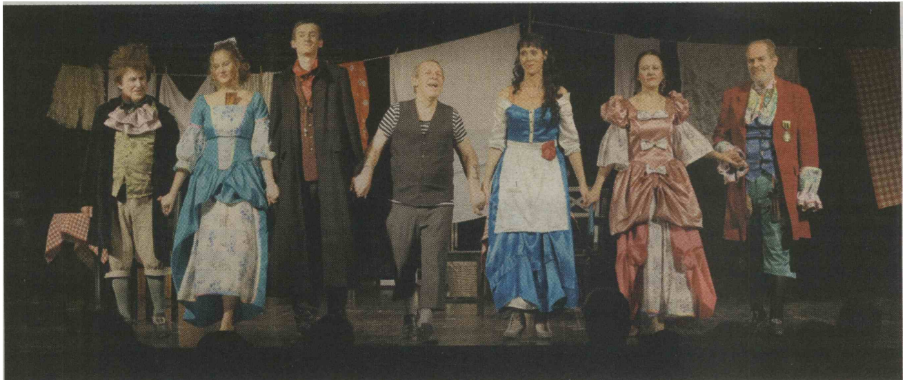
Kot zadnji so se s predstavo Krčmarica Mirandolina izven tekmovalnega dela festivala predstavili člani KUD Zarja Trnovlje.