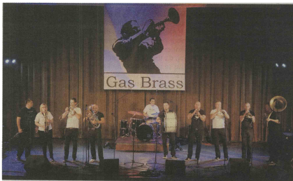
Člani skupine Fešta Bend so znova navdušili z imenitnimi izvedbami znanih domačih in tujih skladb.