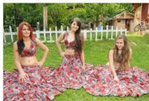
Romsko društvo Romano veseli