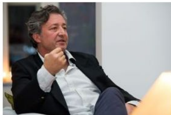
Bojan Bosiljčič v romanu Vražje tirnice skozi ljubezensko zgodbo tenkočutno slika tragiko časa, ko se je lomila nekdanja Jugoslavija.