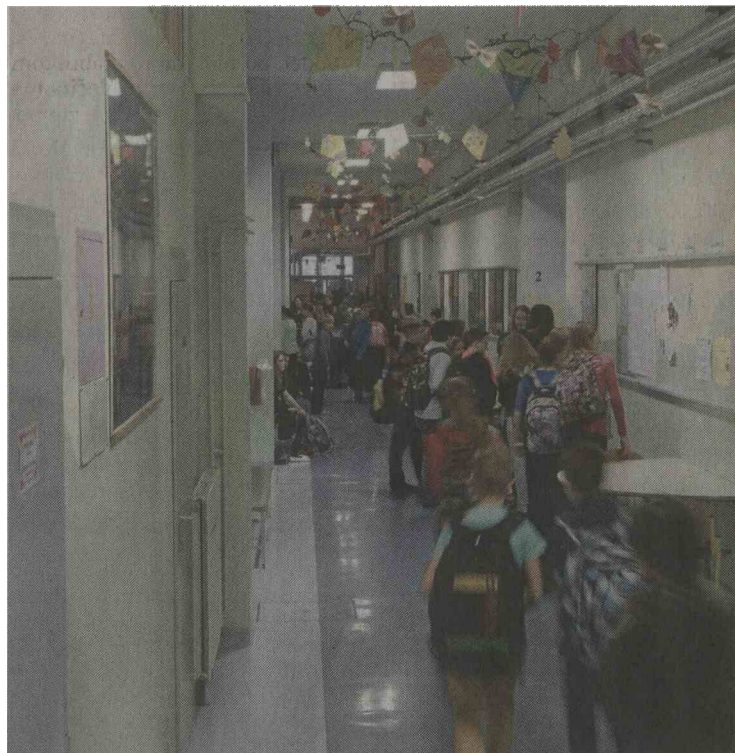
Na šoli potrebujejo novo igrišče in atletsko stezo.

»Napoveduje se prostorska stiska. Potrebovali bi novo otroško igrišče in atletsko stezo, za kar verjamemo, da bomo v sodelovanju z domžalsko občino uredili,« pravi ravnateljica. »Ves čas so ljudje ozaveščeni o tem, kako pomembna je izobrazba, in s tem so povezana tudi prizadevanja krajanov za šolo. Šola ima tako posebno mesto pri sobivanju ljudi. Želimo si, da bi tako zaupanje ostalo še naslednjih petdeset let.«