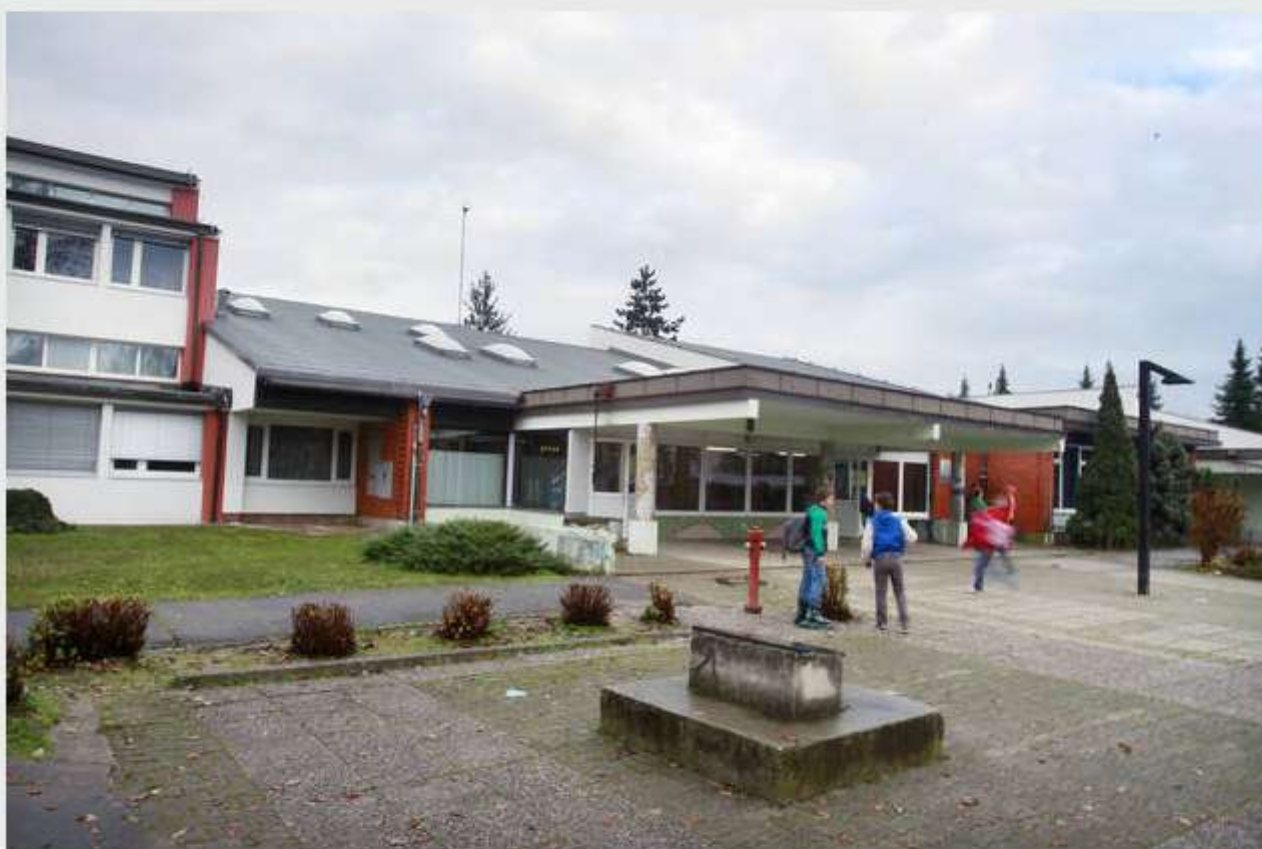
Na šoli potrebujejo novo igrišče in atletsko stezo.

Andreja Žibret, Ljubljana pet, 22.11.2013, 15:00