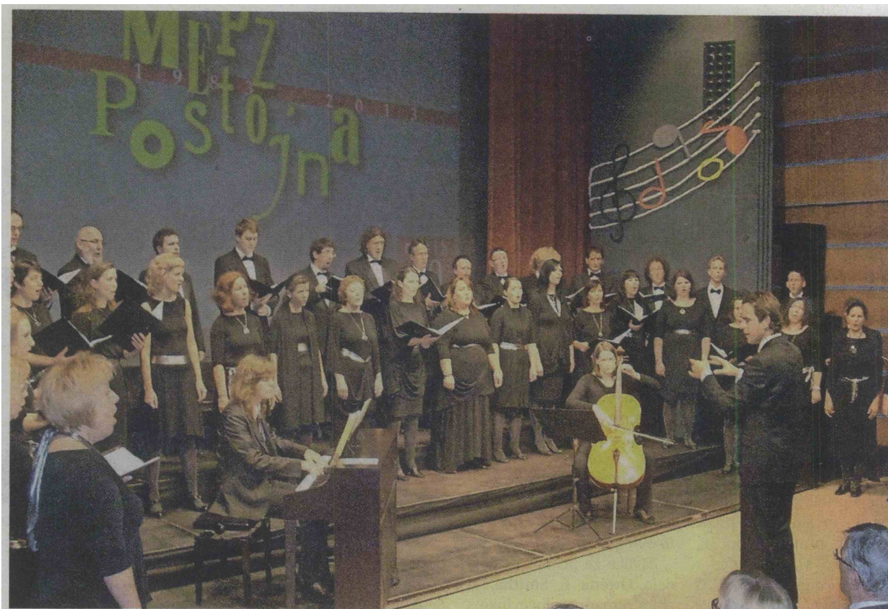
Slavnostni nastop ob obletnici MePZ v Kulturnem domu v Postojni