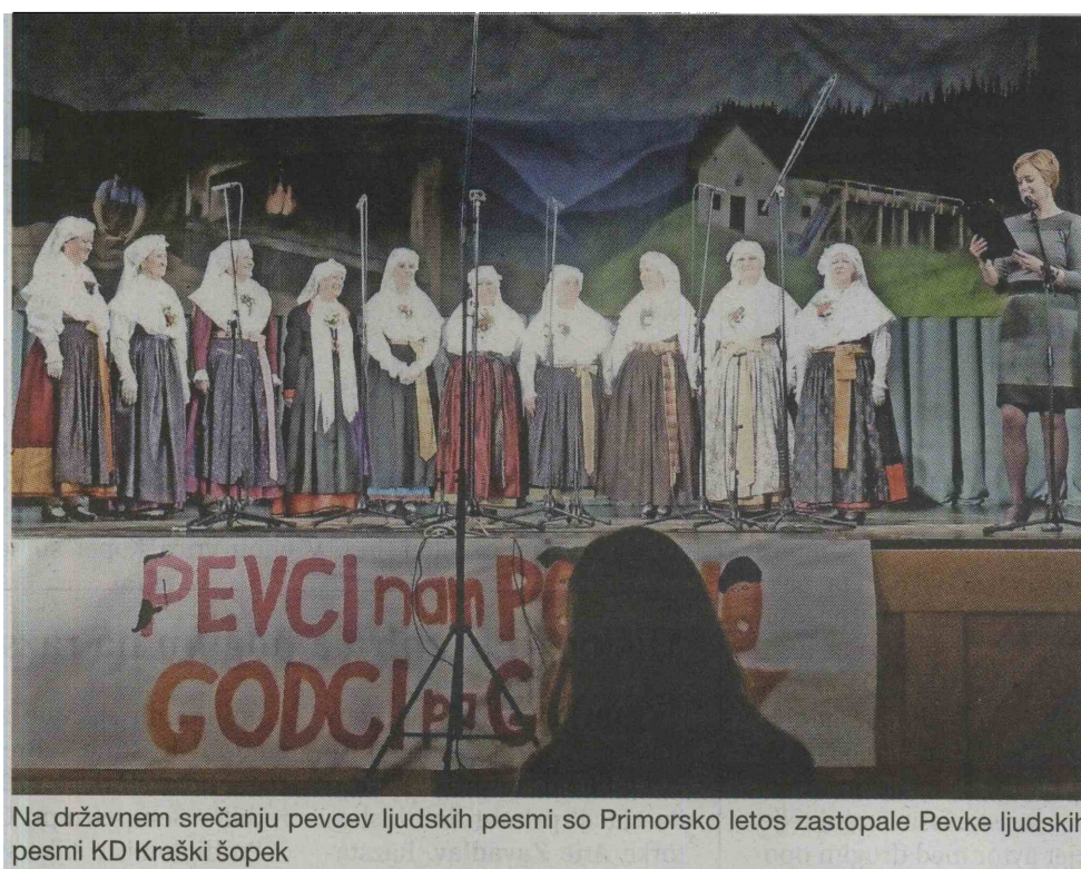
Na državnem srečanju pevcev ljudskih pesmi so Primorsko letos zastopale Pevke ljudskih pesmi KD Kraški šopek