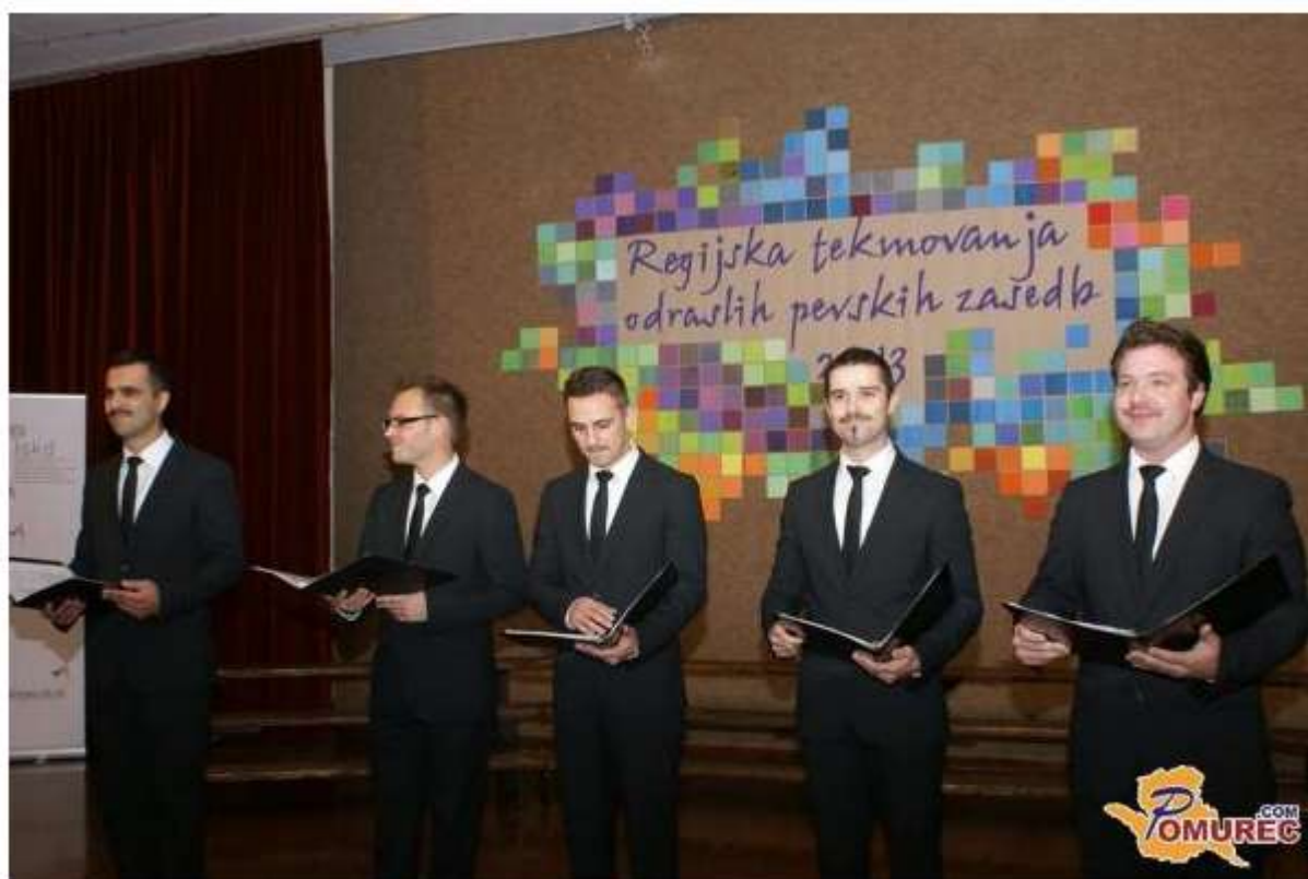
Več fotografij v spodnji galeriji ...