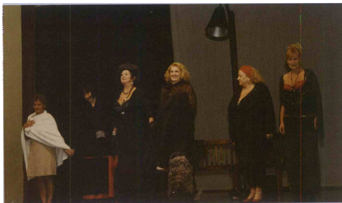
Zlahtne zvezde Mestnega gledališča Ptuj

Vsaka od teh dam ima svojo zgodbo, svoje sanje in zgodbe nam prikazujejo zelo človeško in kljub humornosti pripovedi tudi pretresljivo sliko teh žensk. Na tak način ima zgodba svojo težo in govori o človeškem ozadju tega notoričnega poklica. V predstavi bodo nastopile dame stare šole, najboljše izmed igralk generacije žlahtnih zvezd slovenskega gledališča. (M.N.)