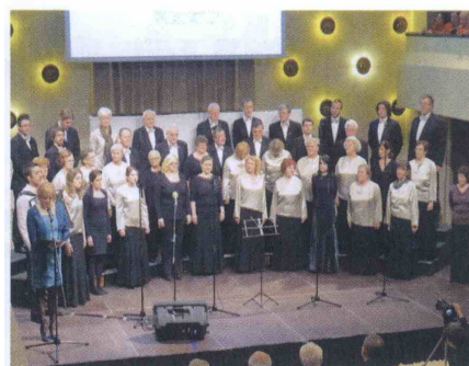
Mešani pevski zbor Zora Janče