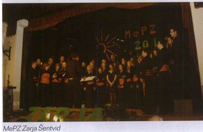
MePZ Zarja Šentvid