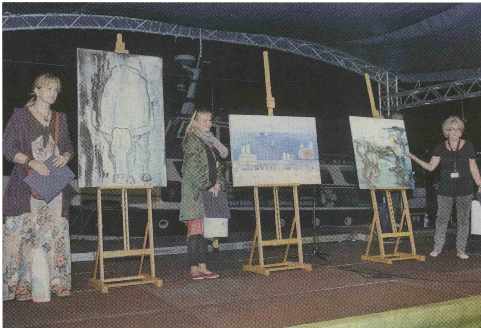
Vsa tri zmagovalna dela je navdahnila Istra