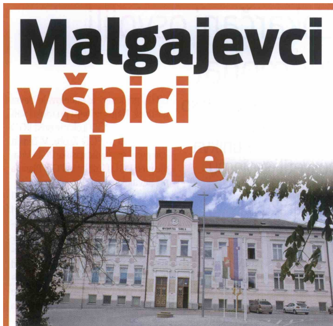
Izmed 54 kulturnih šol je šentjurska v samem vrhu po kvaliteti programa.