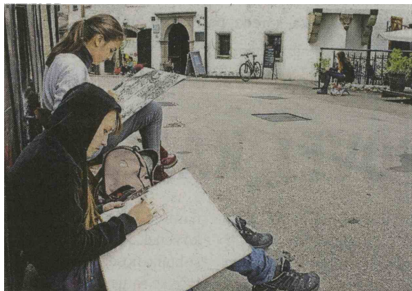
Škofjeloške ulice so bile v petek polne mladih mojstrov risbe in slike.