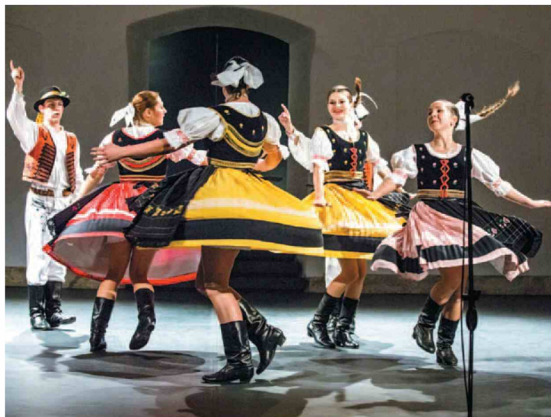
V ptujskem Dominikanskem samostanu je v soboto nastopila tudi Foklorna skupina Inovec iz Slovaške. (Boris B. Voglar)