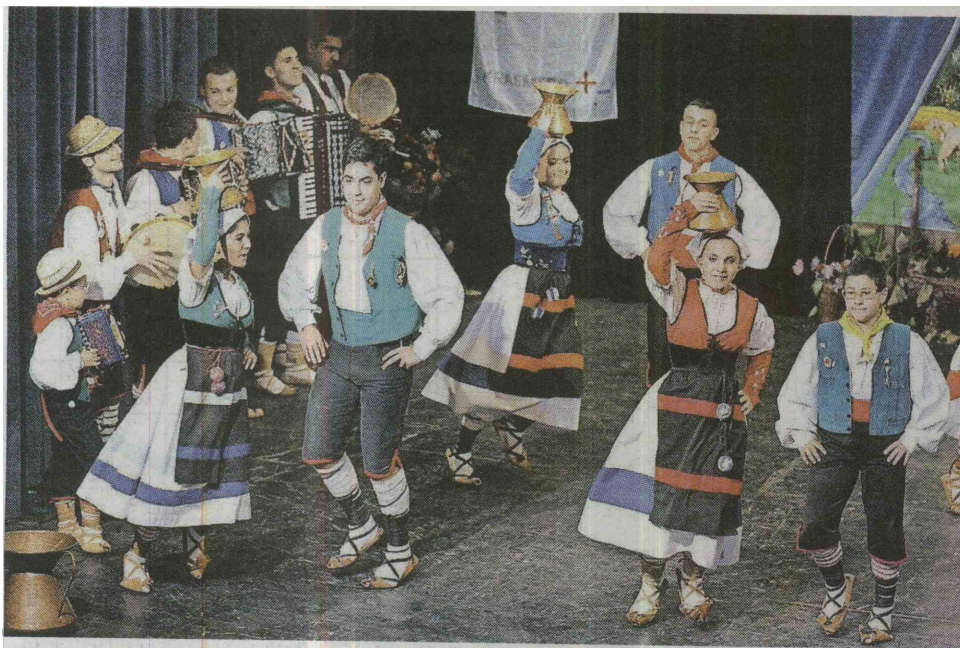
Otroška folklorna skupina Gli Paes Mei Kulturnega društva Paes Mei Folk Group iz Italije se je predstavila z odrsko predstavitvijo avtorja Scandorza Silvia.