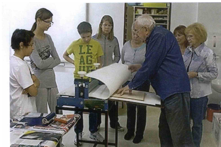
Delavnice so se udeležili učenci 7. in 8. razredov.

Pripravili bodo razstavo v šolski avli s slovesnim odprtjem.