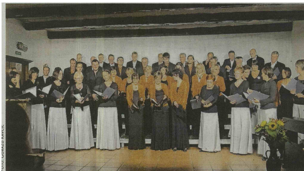
Na koncertu ob 50-letnici sodelovanja so v Kropi nastopili pevci iz Radiš in domači zbori. /