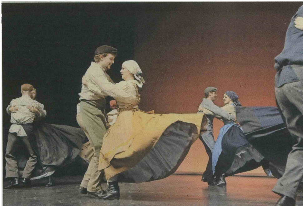
Zlato priznanje s pohvalo so v Veržej odnesli člani in članice FS Leščeček