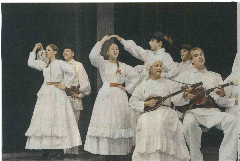
Folklorna skupina iz Dragatuša je predstavila belokranjske plese