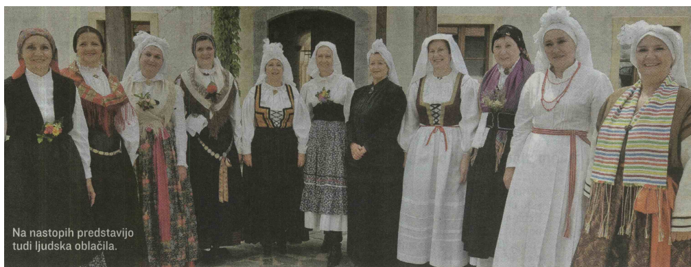
Na nastopih predstavijo tudi ljudska oblačila.