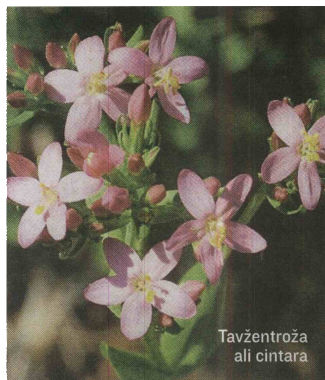
Tavžentroža ali cintara