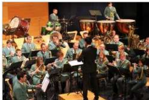
Na 9. reviji pihalnih godb so nastopili tudi Črnomaljši.

Nastopili so pihalni orkestri občine Šentjernej, Kostanjevica na Krki, Krka, Trebnje, Kočevje 1927 in Ribniški pihalni orkester, mestni godbi Novo mesto in Metlika ter godbe Semič, Črnomelj, Šmarješke Toplice in Dobrepolje.