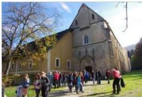
Obisk samostana Pleterje.