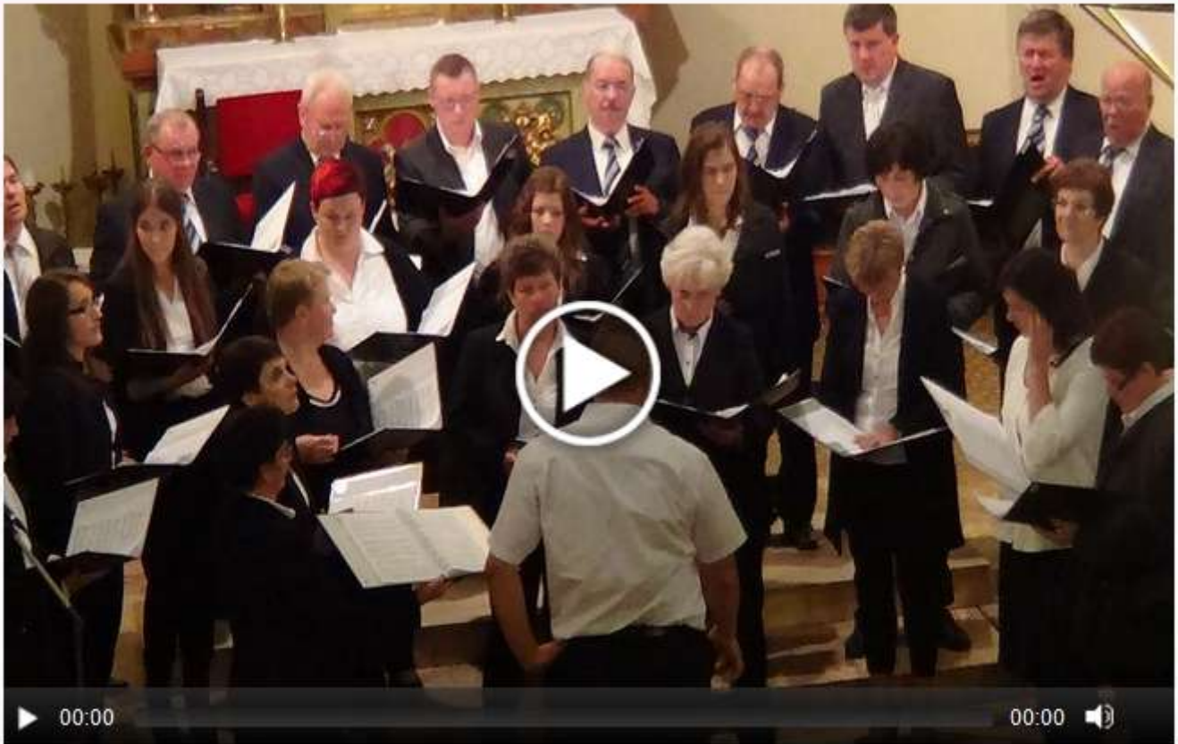
Koncert iz Moeresa