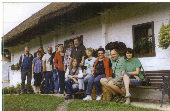
Slikarji ob stari domačiji Arzenakovi domačiji na Dolgi Gori