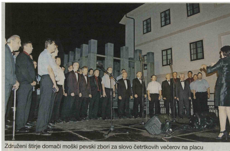
Združeni štirje domači moški pevski zbori za slovo četrtkovih večerov na placu