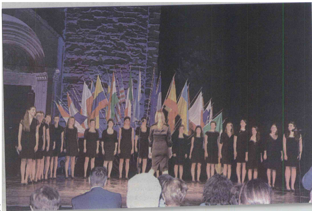
Dekliška vokalna skupina Bodeča Neža na mednarodnem zborovskem tekmovanju v Arezzu

Za tekmovanje v Arezzu je DVS Bodeča neža pripravila tehten in obsežen program, ki ga je predstavila v posameznih tekmovalnih kategorijah. Zajemal je iz različnih zgodovinskih obdobij vse od renesane do romantike in sodobnosti. Dekleta so predstavila številne znane evropske skladatelje, med njimi Tomasa Luisa Da Victorio, Giovannija da Palestina in Francisa Poulanca. Med slovenskimi skladatelji gre omeniti Ambroža Čopija in Lojzeta Lebiča. DVS Bodeča Neža je omenjeni program pripravila v sklopu projekta Pojemo Evropi, ki ga delno sofinancirata Urad RS za Slovence v zamejstvu in po svetu ter Javni sklad za kulturne dejavnosti .