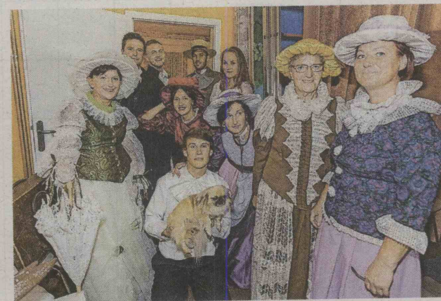
Igralska zasedba KD Mekinje se je predstavila s predstavo Damski krojač.