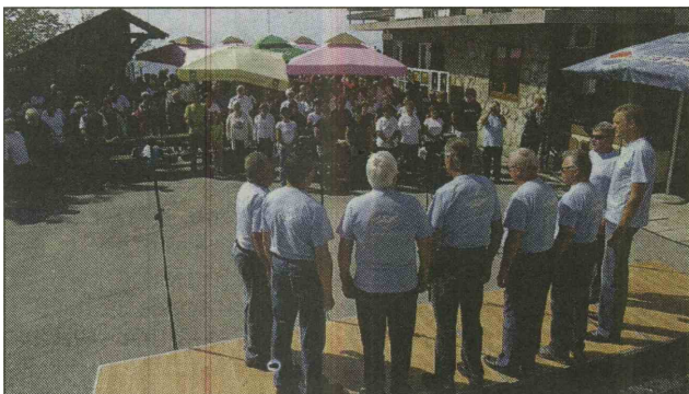
Lisca poje 2013

Planinska pevska skupina Encijan, ki deluje pod okriljem Planinskega društva Lisca Sevnica, in Tončkov dom na Lisci v sodelovanju z meddruštvenim odborom planinskih društev Zasavje, Občino Sevnica, KŠTM Sevnica, Zvezo kulturnih društev Sevnica in sevniško območno izpostavo javnega sklada za kul-