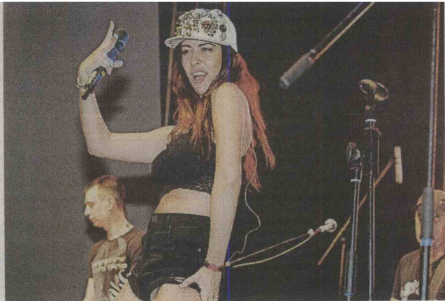
Priljubljena srbska pop skupina Luna je nastopila v soboto v navijaški coni na Stari Savi.