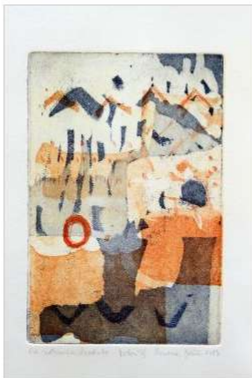
Rowena Božič - Vrhovi IV.