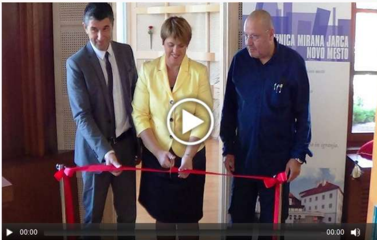
Otvoritev multimedijske sobe