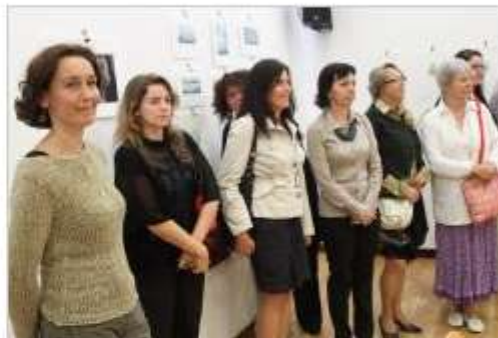
Udeleženci grafičnega programa likovnega ateljeja JSKD.