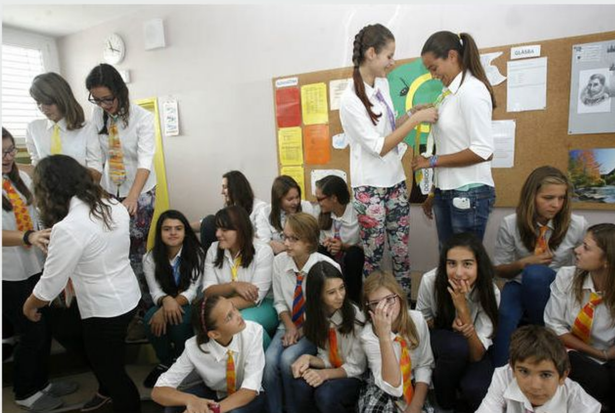
Mladinski pevski zbor med vajo - kravate so poslikali sami.