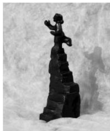
Matiček, nagrada za najboljšo predstavo.