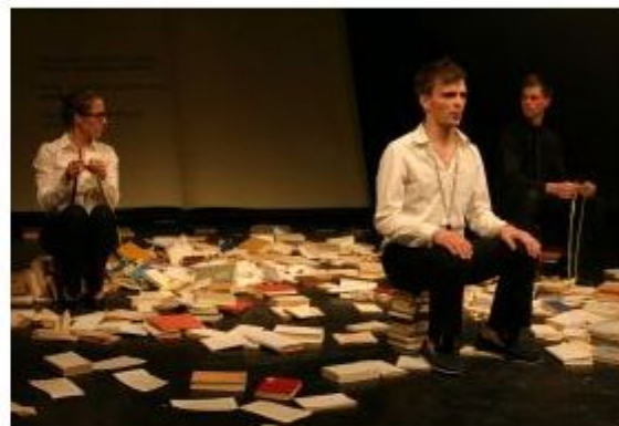
Vaje iz sedenja v izvedbi Teatra Šentjanž, ena izmed predstav spremljevalnega programa.