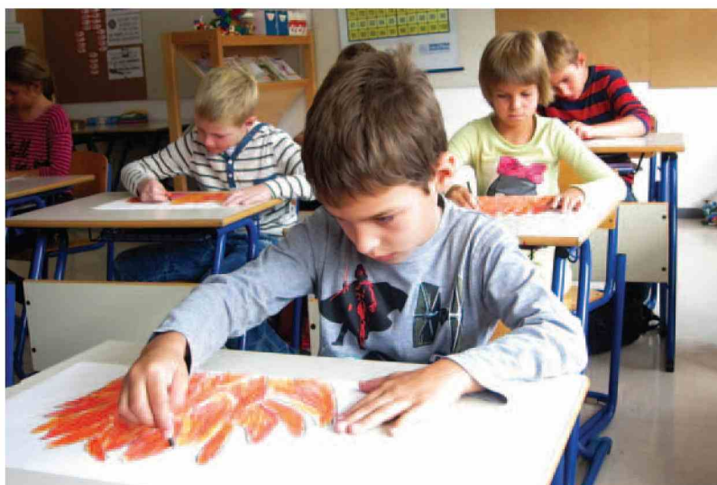
Radeljska osnovna šola izstopa na likovnem področju. (Jasmina Detela)

Na radeljski OŠ se trudijo ponudbo svojih kulturnih dejavnosti kar najbolj približati učencem, njihovim staršem in krajanom. Ohranjajo tradicionalne kulturne vrednote, po drugi strani pa nenehno iščejo nove oblike in kulturne vsebine, s katerimi bi učencem še bolj približali kulturno dejavnost. Pri tem so zelo uspešni, saj je vsak učenec vključen v najmanj eno kulturno dejavnost in tudi zaposleni so posredno ali neposredno vpeti v kulturno do-