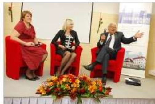
Zadnji septembrski pogovorni večer v Knjižnici Mirana Jarca