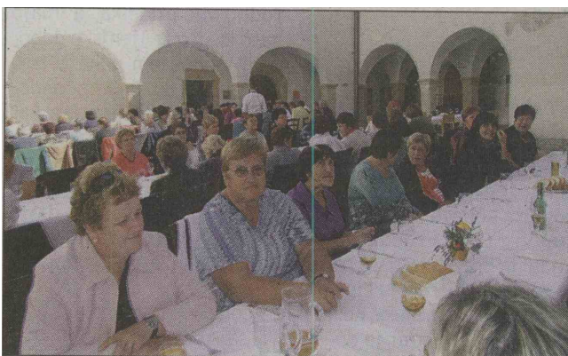
Del udeleženk srečanja posavskih kmetic

nim programom Osnovna šola dr. Mihajla Rostoharja. Z namenom dvigniti dodano vrednost posavskih lokalnim proizvodom, znotraj tega pa čziviti in promovirati tradicijo zeliščarstva, bo projekt potekal do sredine meseca novembra prihodnje leto.