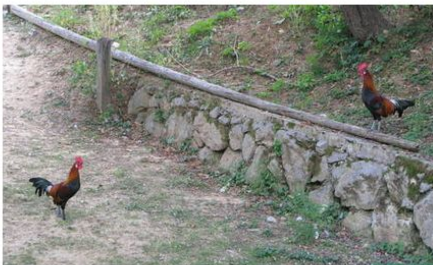
Petelinjenje pravih petelinov.