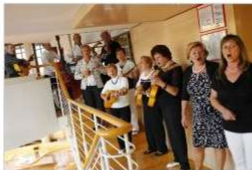
Tamburaši Folklornega društva Kres