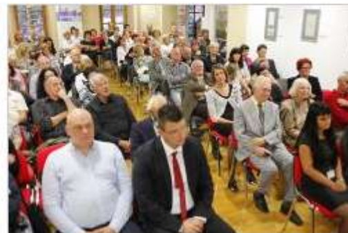
Polna dvorana v prešernem vzdušju