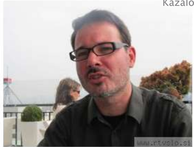
Linhartovo srečanje zadnjih osem let poteka v Postojni, kjer so jih, kot pravi Šmalc, zelo lepo sprejeli. "Zdaj že rečemo, da se vidimo v Postojni in ne na Linhartovem srečanju."