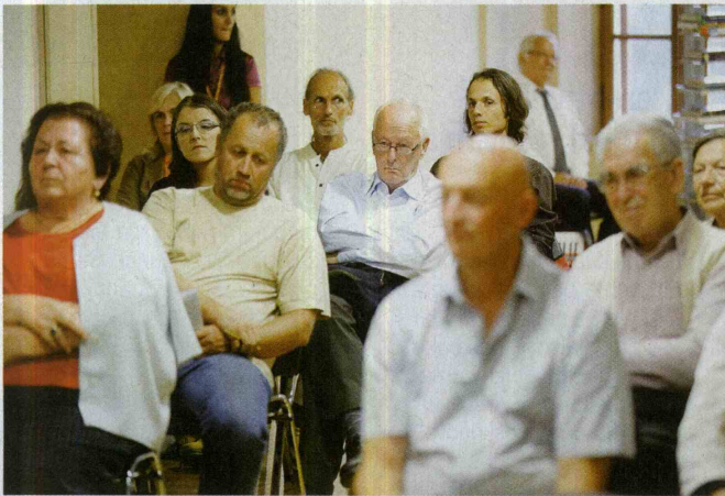
Obiskovalci v Trdinovi čitalnici.