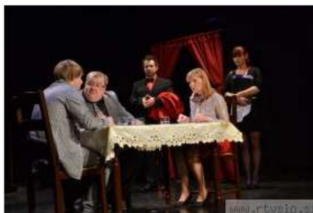
Teater KD Janez Jalen bo danes zvečer predstavil Ano Migreno.