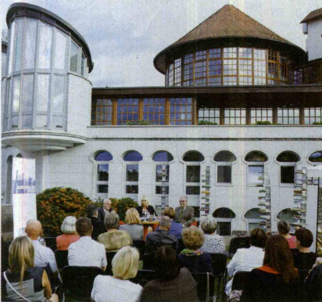
Poletni večeri pod paviljoni.