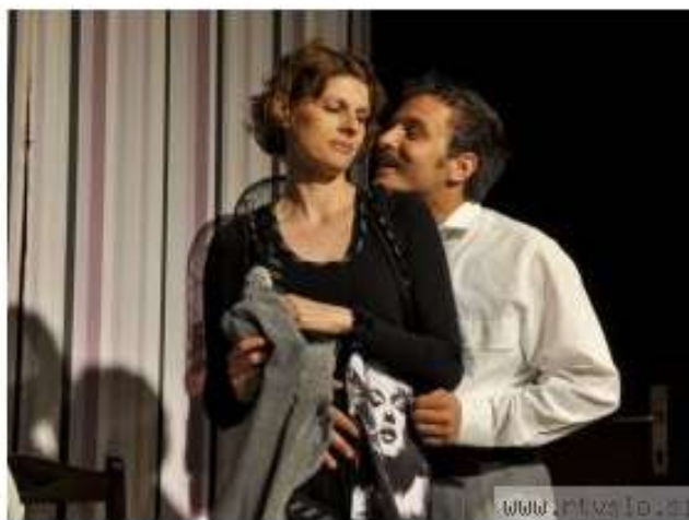
Prizor iz predstave Burka o jezičnem dohtarju, ki bo v Postojni na ogled jutri.