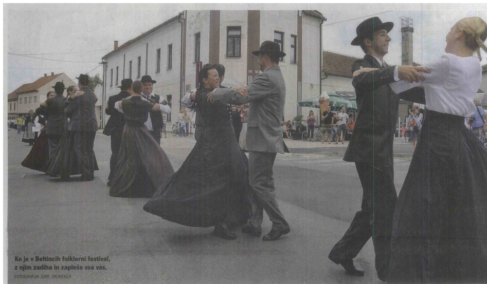
Ko je v Beltincih folklorni festival, z njim zadnja in zapleše vsa vas.