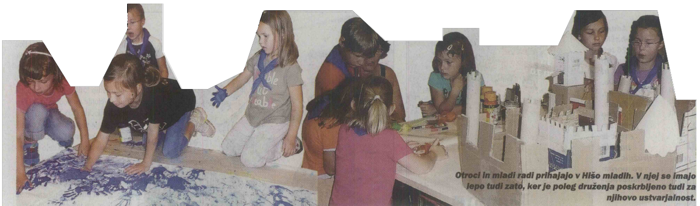
Otroci in mladi radi prihajajo v Hišo mladih. V njej se imajo lepo tudi zato, ker je poleg druženja poskrbljeno tudi za njihovo ustvarjalnost.