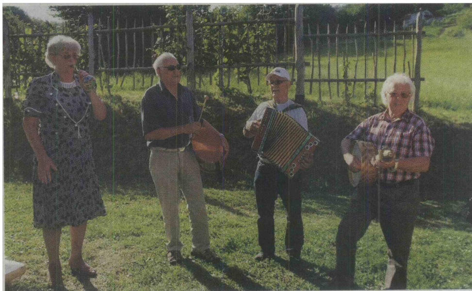
Planinski band Rogaške Slatine je na doma narejenih glasbilih zaigral nekaj domačih viž.