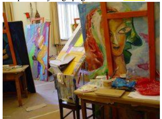
Tema letošnje delavnice je avtoportret – refleksija ponotranjenega pogleda.