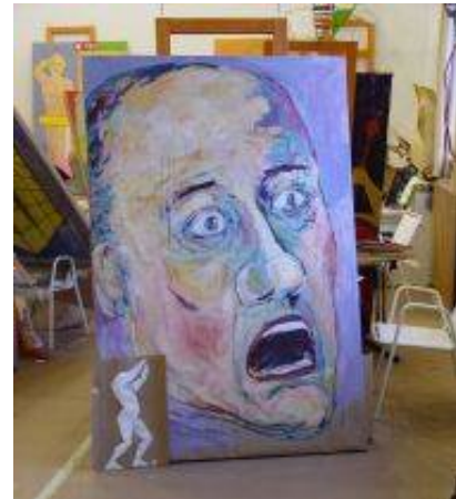
Tema letošnje delavnice je avtoportret – refleksija ponotranjenega pogleda.

Poudarek je sicer na skupinskem delu, v okviru skupaj dogovorjenih formalnih izhodišč pa nato vsak ustvarjalec išče lasten izraz. Ključna je vloga mentorja, ki zastavlja vprašanja in pomaga pri iskanju odgovorov. Za ustvarjalce so dragocene posebne okoliščine, možnost soočenja z ustvarjalno močno osebnostjo in z najnovejšimi tendencami v umetnosti. Razstava, ki jo vsako leto odprejo kot predstavitev aktualnega ustvarjanja, pa je običajno drugačna od vsega, kar običajno razumemo pod oznako "ljubiteljsko slikarstvo".