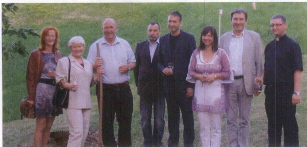
Vsi, ki so bili soudeleženi pri sajenju in zalivanju lipe.