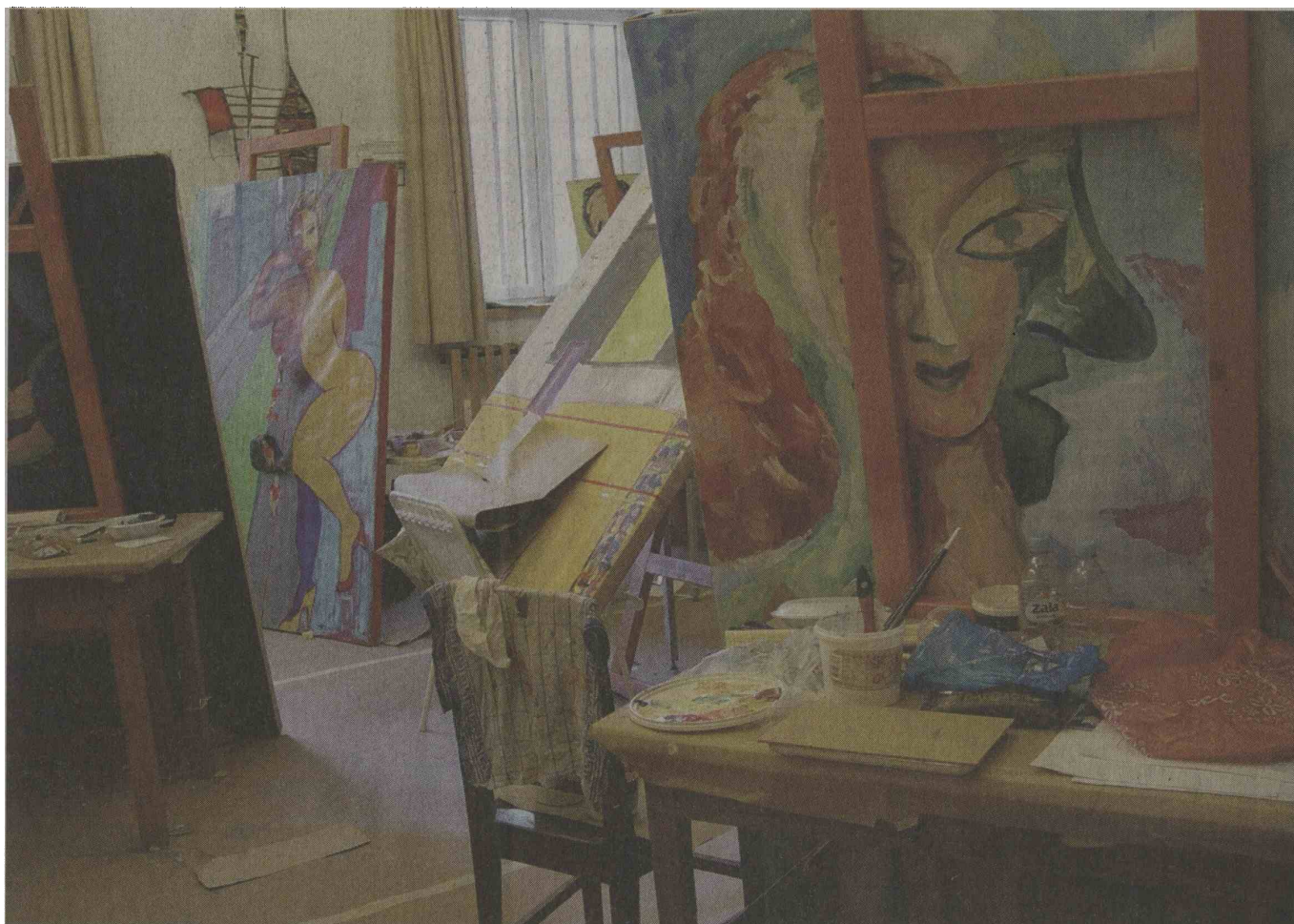
Delo na likovni delavnici je zelo individualno, strnjeno in naporno, umetnine pa vsako leto presenetijo celo profesionalce.