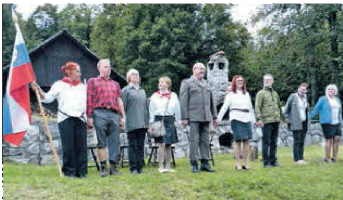
Igralci Gledališke skupine Zik Črnomelj so, tako kot vedno doslej, tudi tokrat navdušili s predstavo ob koncu poletne gledališke šole.