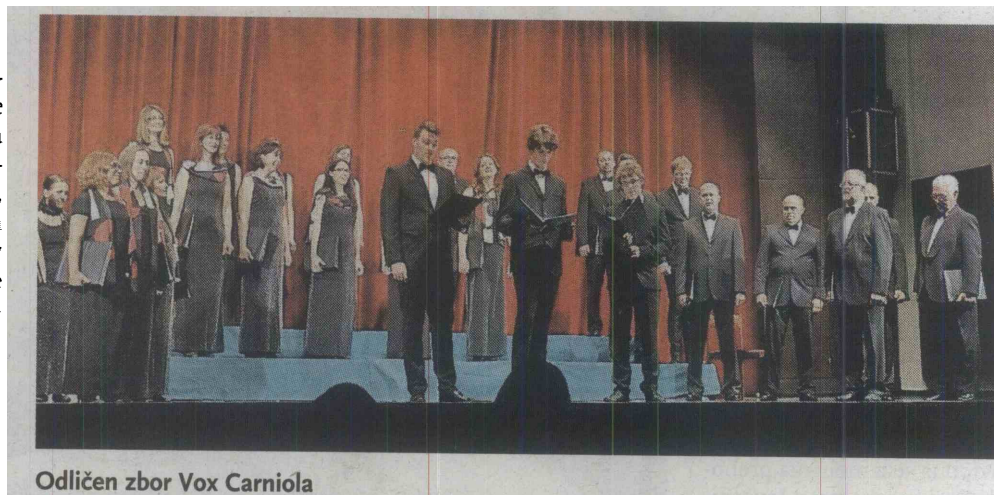
Odličen zbor Vox Carniola