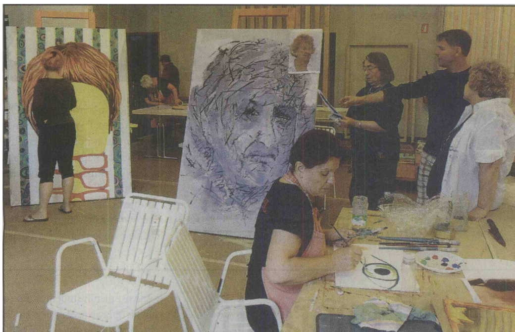
Udeleženci so raziskovali sebe skozi ustvarjalni dialog s samim seboj.