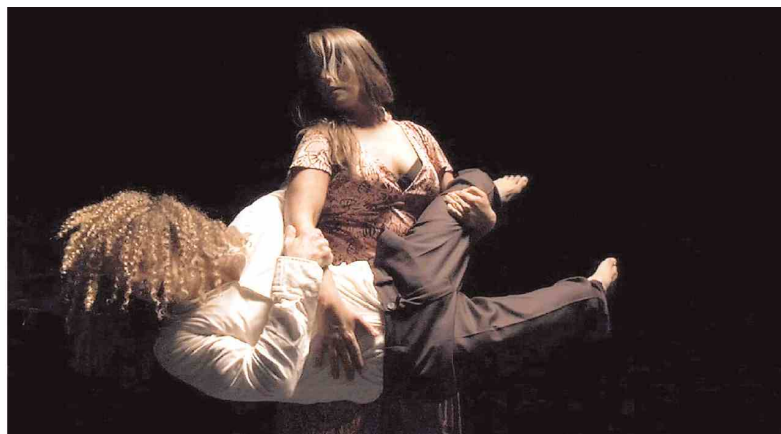
Predstavo Opora španske skupine La Intrusa Danza, ki bo v soboto sklenila tridnevno plesno dogajanje v Murski Soboti, zaznamuje intenziven kontaktni ples.