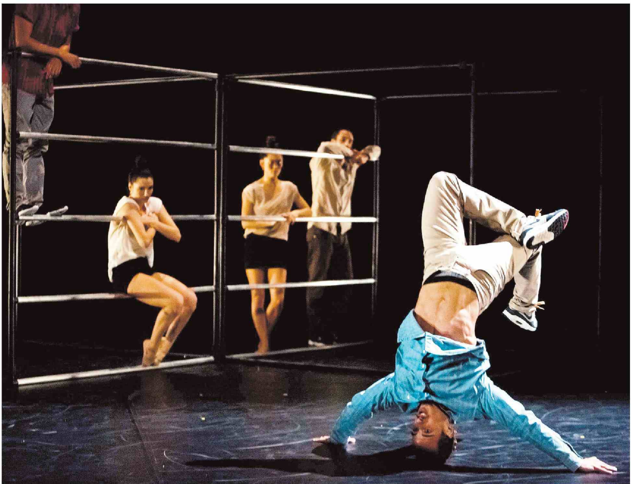
V predstavi Meja, ki bo nocoj odprla deveti festival sodobnega plesa Fronta, se prepletajo prvine hiphopa, sodobnega plesa in navideznega lebdenja.

Naročnik: JAVNI SKLAD RS ZA KULTURNE DEJAVNOSTI Objave so namenjene interni uporabi v skladu z odločbami ZASP in se brez soglasja imetnika pravic ne smejo prosto razmnoževati in distribuirati! Klipping d.o.o.