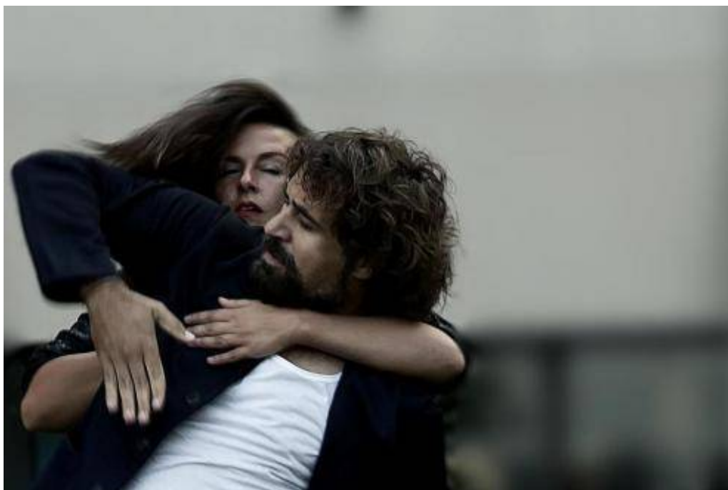
DELTA VICTOR

Murska Sobota bo s festivalom Front@ sodobnega plesa do konca tedna ponovno evropsko središče plesa. Festival bo odprla francosko-nemška predstava Meja (Borderline) zasedbe Company Sebastien Ramirez. Letošnji, deveti festival zaznamuje dela z izjemnim, delno tudi akrobatskim plesom, ki odseva stiske in trenja našega časa.