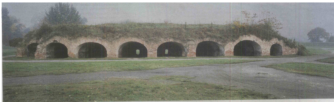
Skoraj »hotelček« za seks avanturiste v Osijeku