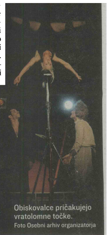
Obiskovalce pričakujejo vratolomne točke.