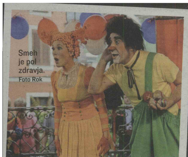
Smeh je pol zdravja.

leta, pri čemer si želimo, da bi še naprej spodbujali razvoj te umetnosti v Sloveniji in uprizarjali čim več produkcij z domačimi umetniki, ki bi jih predstavili ne le doma, pač pa tudi v tujini,« nam je načrte za prihodnost zaokrožila Danetova. Na vprašanje, kako se na klovnovske predstave odziva občinstvo, pa je duhovito odgovorila: »Odziv na naše klovne in cirkusante je zagotovo veliko, veliko boljši kot na tiste iz parlamenta, ki se jim tudi ves čas smejimo!«