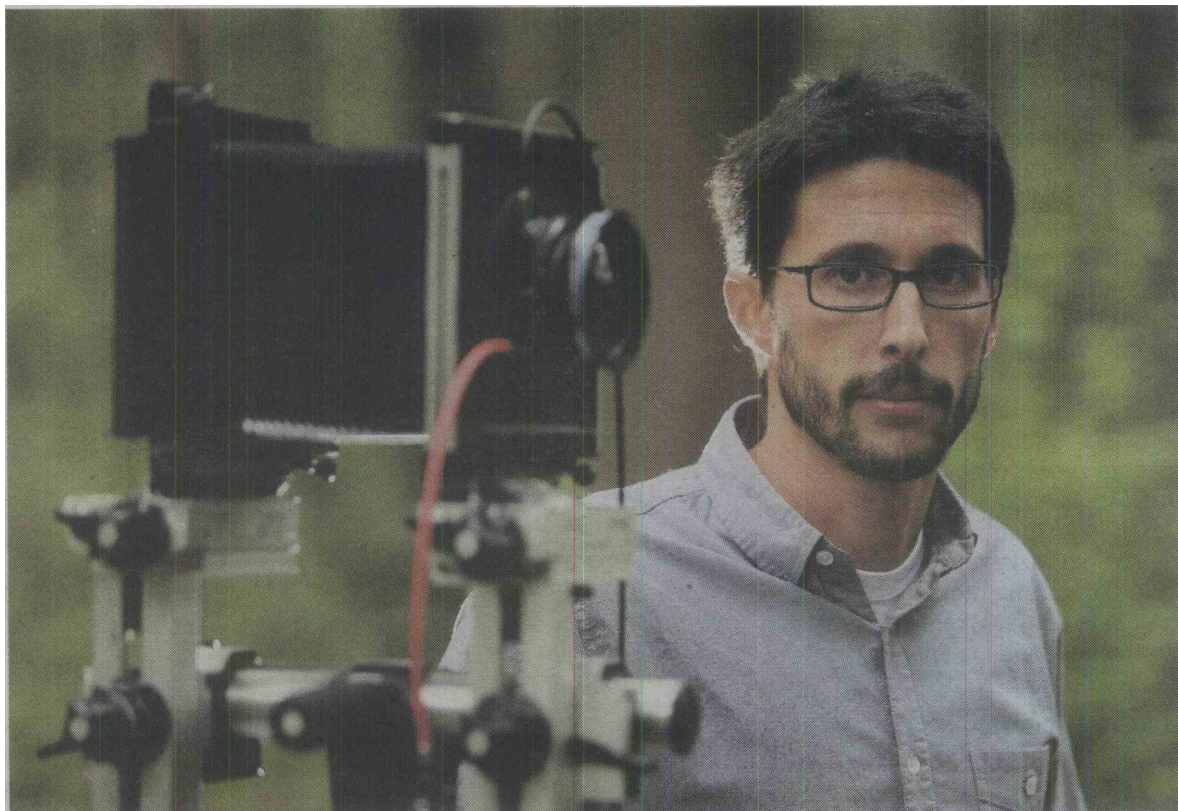
aka Babnik na enem ljubljanskih »jebodromov«