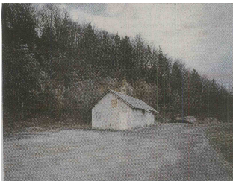
Eno od zasilnih ljubezenskih gnezd v Podutiku