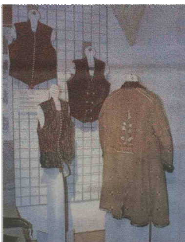
Moški kožuh z vezenino na hrbtu in telovniki