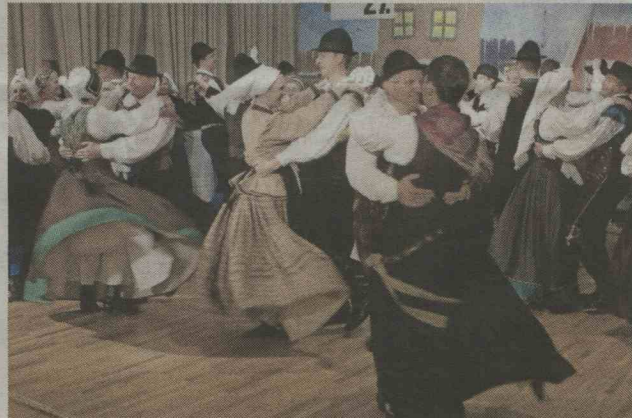
FS Sava je na petem pokrajinskem folklornem večeru prikazala Gorenjsko v besedi, glasbi, petju in plesu ter oblačilih.