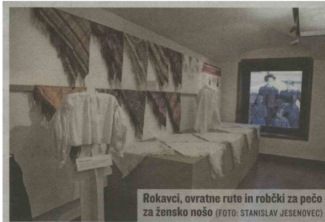
Rokavci, ovratne rute in robčki za pečo za žensko nošo