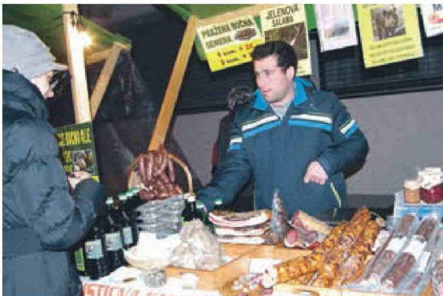
Tudi domača salama, špehovka, slanina, bučno olje, semena ipd. so lepa decembrska darila. V Škocjanu jih je ponujala turistična kmetija Balon z Bizeljskega.