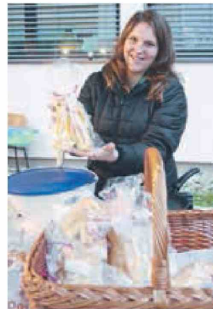
Take lepe kvašene parkeljčke pečejo na Bučki.

Vse pa je najbolj razveselil obisk sv. Miklavža, ki ni priše