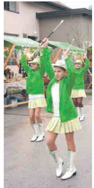
Mažoretke so ogrele obiskovalce.