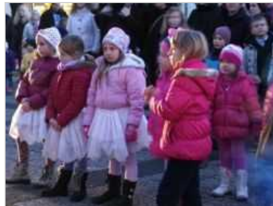
Z včerajšnjim dogajanjem in prižigom prazničnih lučk so začeli veseli december.

Trebnje - V trebanjskem parku so včeraj začeli dogajanje v sklopu letošnjega veselega decembra. Popoldansko dogajanje so odprli z igrano predstavo Živali pri babici Zimi, ki so jo pripravili v tukajšnjem vrtcu Mavrica, v nadaljevanju pa so nastopil člani Občinskega pihalnega orkestra Trebnje in trebanjske mažorete. Sledil je še slavnostni prižig prazničnih lučk, ki sta jih z odštevanjem prižgali najmlajši mažoreti.