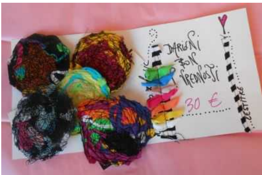
Atelje Dobrovoljc podarja pet atraktivnih brošk, zmagovalcu pa bon v vrednosti 30 evrov.