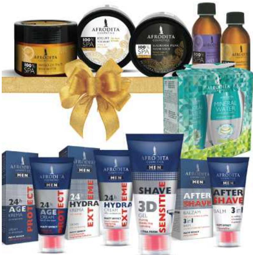
Izdelki Kozmetike Afrodita za glasovalce in Naj koregrafa/koreografino in Naj predstavo/koreografijo.