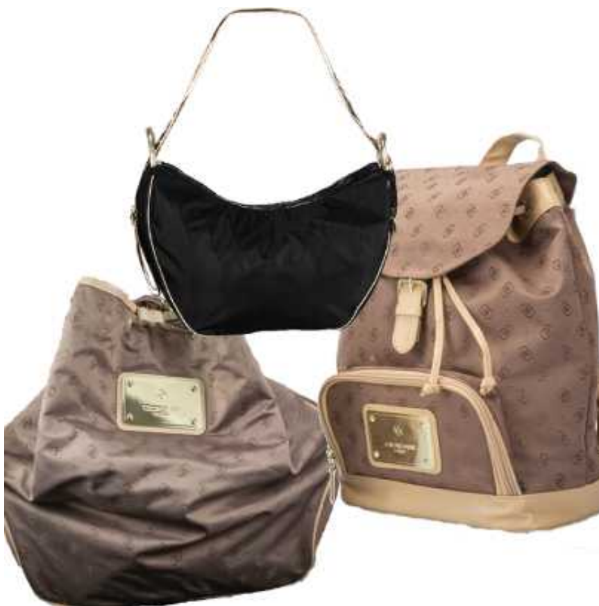
Torbe Giordani Gold kozmetike Oriflame za glasovalce in Naj plesalca, plesalko in par.