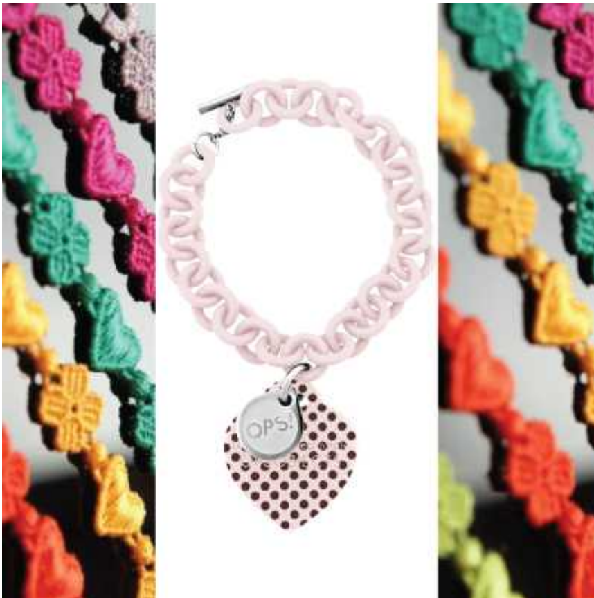
Zapestnice Cruciani za glasovalce in zapestnica OPS! za Naj plesni dogodek leta 2014.