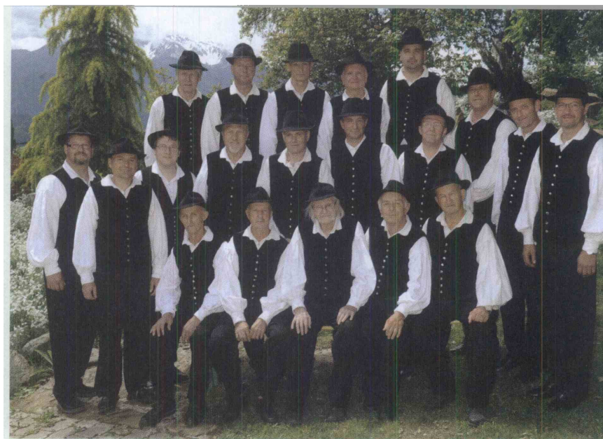
Moški pevskega zbora Šentanelski pavri

V želji, da bi primerno proslavili visok pevski jubilej in tudi doprinesli svoj prispevek k ohranjanju naše žive kulturne dediščine, smo zadnji dve leti pospešeno