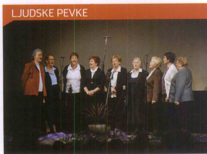
Ljudske pevke Rogatec so nastopile na državnem srečanju ljudskih pesmi.