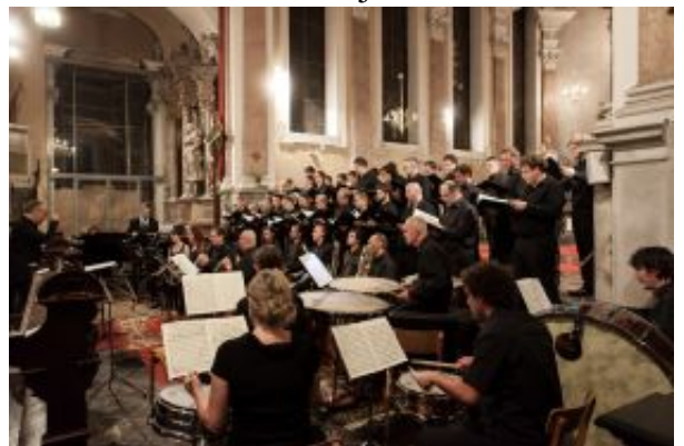
Vsem delom, uvrščenim na program, je skupen premislek o vojnih dogodkih.

Spremljajte tudi nagrajeno MMC-jevo spletno mesto, posvečeno 100. obletnici 1. svetovne vojne.