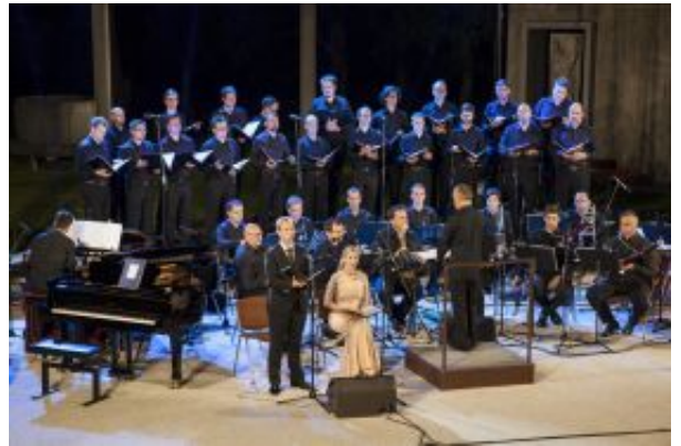
Organizator koncerta je ustanova Imago Sloveniae, v sodelovanju z Glasbeno matico.