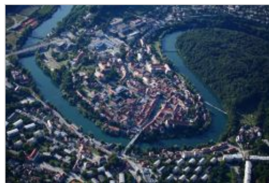
Novo mesto bo prihodnje leto praznovalo 650. obletnico ustanovitve.