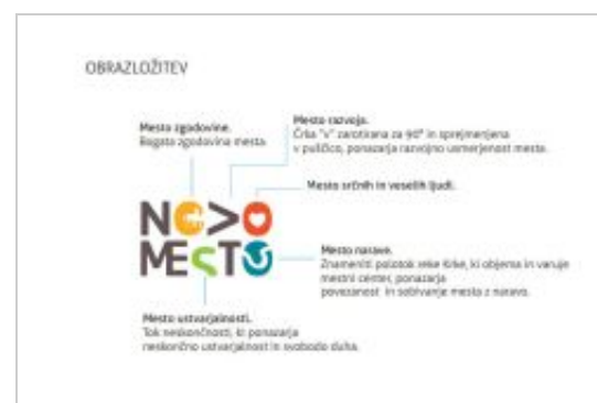
Logotip 650. obletnice ustanovitve Novega mesta z obrazložitvijo (Avtor: Gregor Ivanušič)