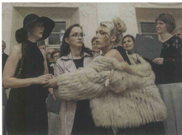
Igralci Kulturno-umetniškega društva Linhartov oder so Županovo Micko predstavil v sodobni preobleki.

Na prireditvi so nastopili tudi Moška pevski zbor Podnart in Kropa ter Mešani pevski zbor Koledva. Pod vodstvom letošnjega občinskega