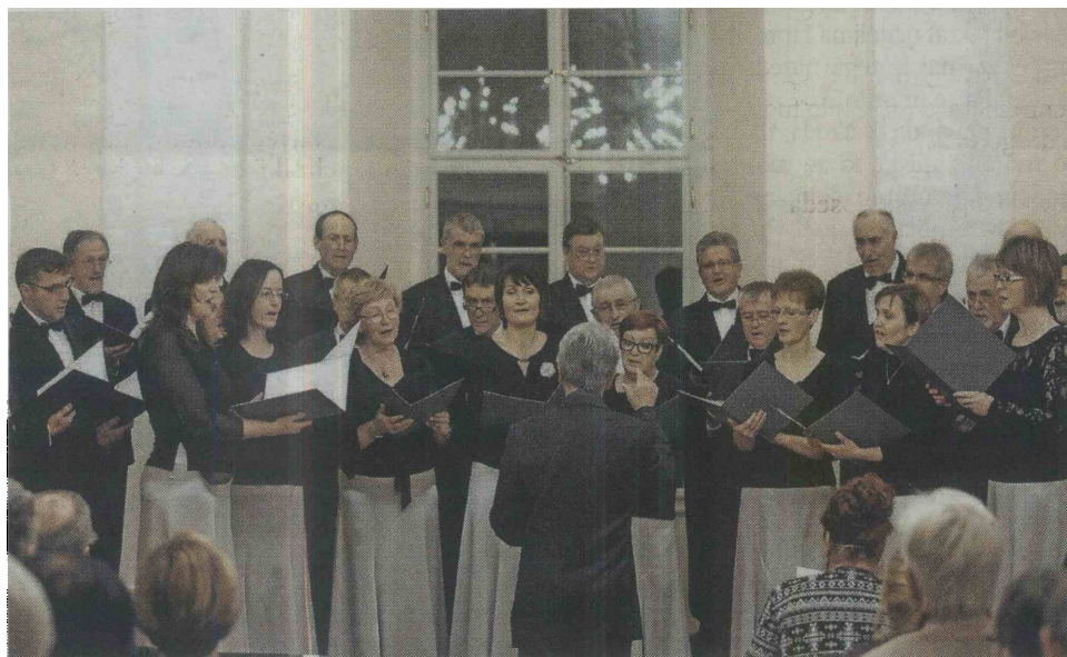
Nastopili so tudi Moška pevski zbor Podnart in Kropa ter Mešani pevski zbor Koledva.