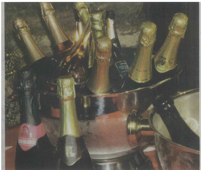
Penina je boljša čim hladnejša.