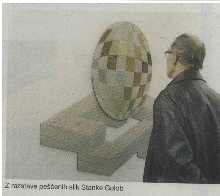
Z razstave peščenih slik Stanke Golob