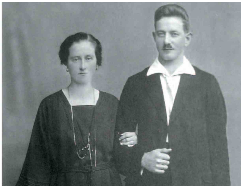
Stare fotografije iz družinskih arhivov bodo osnova za izdelavo folklornih kostumov.