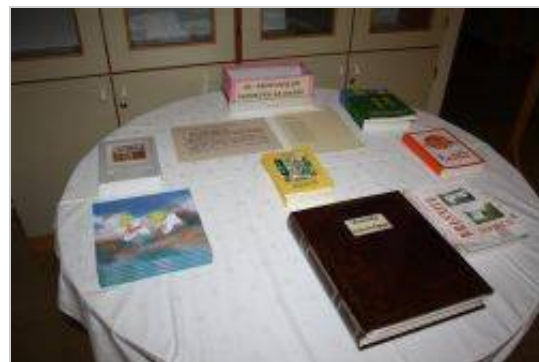
OŠ Brusnice je v zadnjih letih izdala 7 knjig.