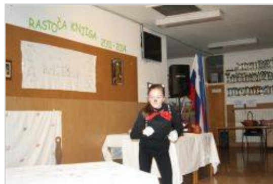
Premierno so uprizorili odrsko igro Brusniška ohcet.