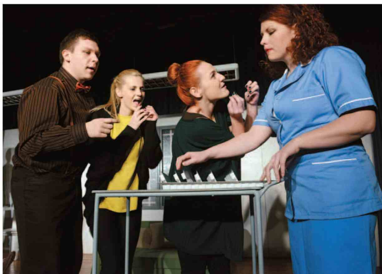
Utrinek z letošnje gledališke predstave Šus teatra iz Dražencev