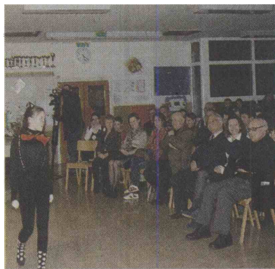
Brusniška ohcet je naredila dober vtis na občinstvo.