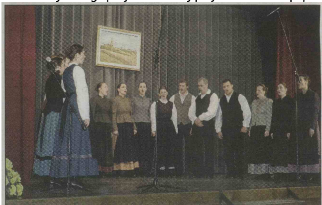
Nastopila je tudi domača folklorna skupina.

ARTICE - 15. februarja se je v Prosvetnem domu v Artičah odvijalo 17. območno srečanje pevcev ljudskih pesmi in godcev ljudskih viž, ki so ga naslovili »Kdor hoče še pet', mora skrajja začeti«. Prireditev je potekala v organizaciji JSKD - Območne izpostave Brežice in ljudskih pevcev Fantov artiških KUD Oton Župančič Artiče. Slednji so na odru nastopili prvi, v deželo ljudskega petja in melodij pa je obiskovalce pope-