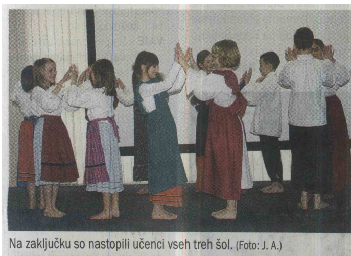
Na zaključku so nastopili učenci vseh treh šol.