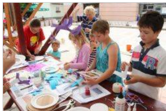
Na ploščadi pred KKC-jem so potekle ustvarjalne delavnice pod okriljem krajevne knjižnice.