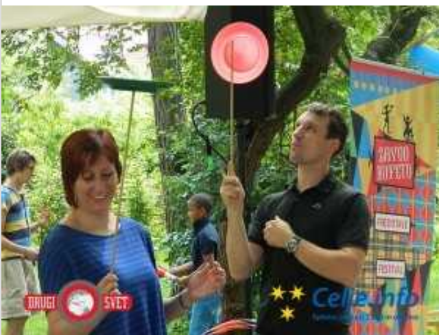
Tudi Celjani so lahko postali cirkuški artisti.

Klovnbufova festivalska karavana je vsak dan popestrila dogajanje na celjskih ulicah.