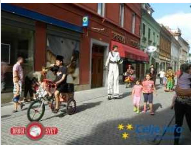
Klovnbufova festivalska karavana se je sprehodila skozi celjske ulice.

Kategorija: Naslovni modul • Zabava | 15. jul 2014 ob 13.10 | Komentarji (0)