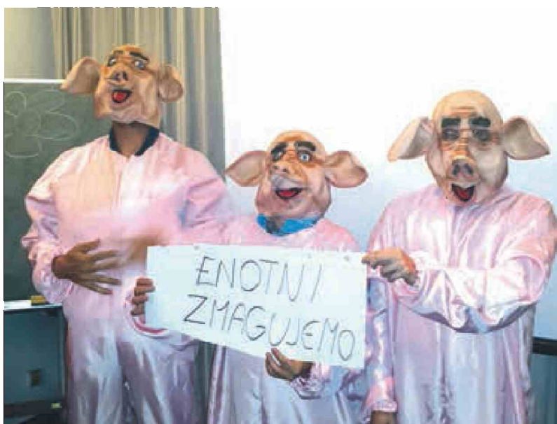
Aktivni državljani, kot so se poimenovali, so tik pred volitvami z akcijo Svinjska stranka opozarjali na katastrofalno stanje v državi na področju politike, denarja in pokvarjenosti. Pri tem so se odeli v kostume svinj (pri koritu).

Potrdila pa se je tudi teza predsednika ene od podgorskih krajevskih skupnosti, da lahko SDS v prvi novomeški okraj »za kandidata po-