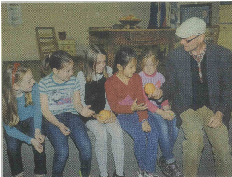
Igor Habjan je upodobil lik pesnika, ki je bil priljubljen med otroki.