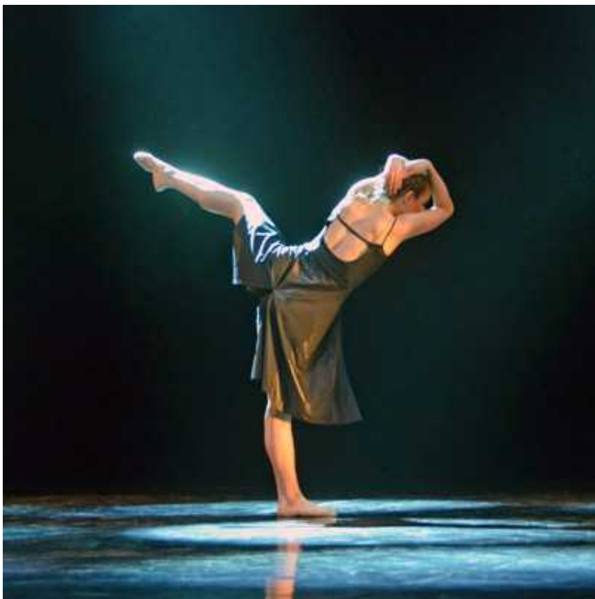
Kjara's Dance Company.