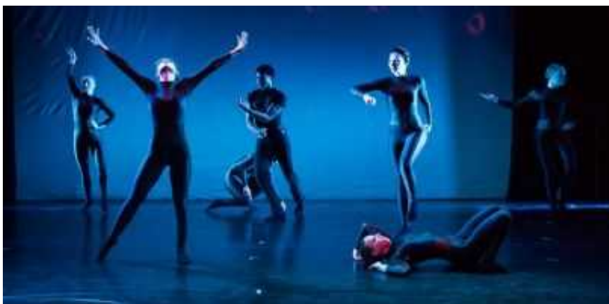
Kaj me pleše?