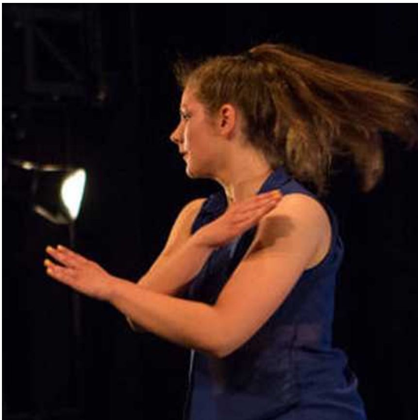
No Uniform.