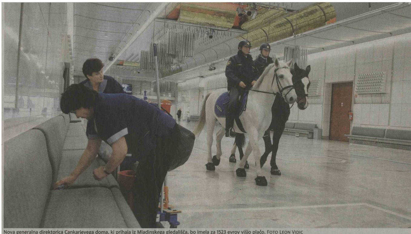
Nova generalna direktorica Cankarjevega doma, ki prihaja iz Mladinskega gledališča, bo imela za 1523 evrov višjo plačo.

4863 evrov bruto je znašala aprilska plača ministra za kulturo Uroša Grilca