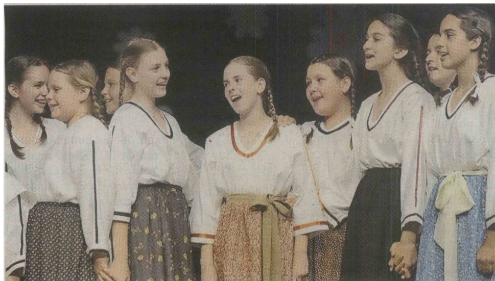
Otroška folklorna skupina Val Osnovne šole Koper.

Državno srečanje otroških folklornih skupin je pripravil Javni sklad Republike Slovenije za kulturne dejavnosti ( JSKD ). Izvedbo prireditve je prevzela Območna izpostava JSKD Novo mesto, pomoč pri izvedbi pa osnovna šola Šentjernej. KF