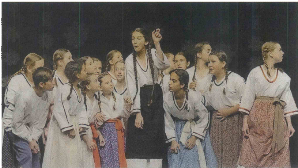
Otroška folklorna skupina Val Osnovne šole Koper.