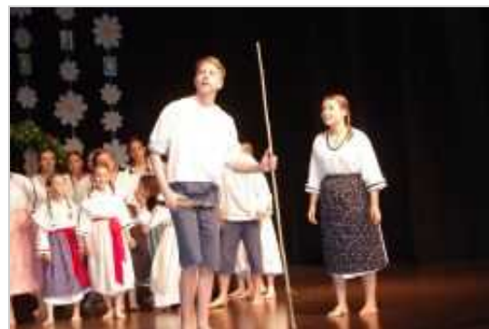
OFS Val iz OŠ Koper.

Kot gostje so nastopili folklorniki OFS Društva Slovencev Triglav iz Banja Luke, po tekmovalnem delu pa je bil bogat tudi revialni program s pevskimi in godčevskimi otroškimi folklornimi skupinami.