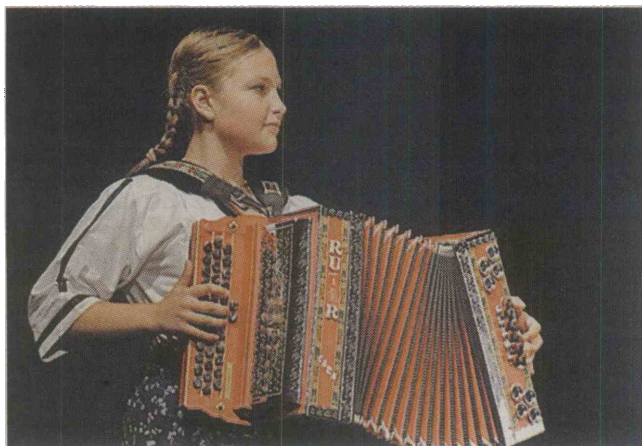
Članica otroške folklorne skupine Val Osnovne šole Koper.