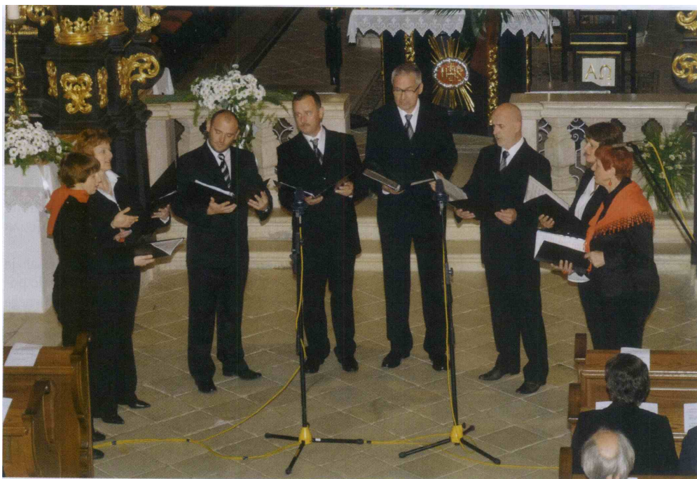
Vokalna skupina Freya.