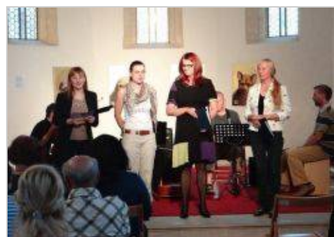
Tekst: Helena Vukšinič, JSKD OI Črnomelj

Organizatorja delavnice in literarno-glasbenega večera: Območna izpostava JSKD Črnomelj in Knjižnica Črnomelj