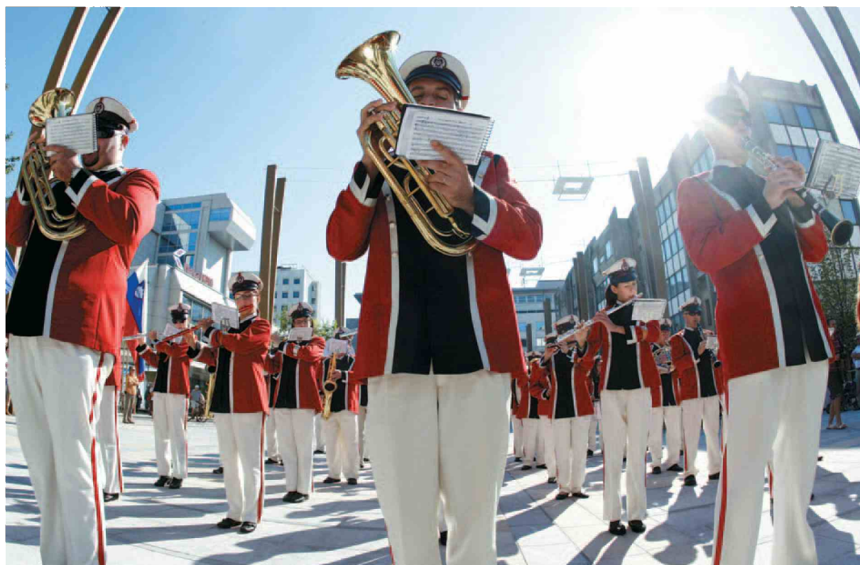
Nastopi pihalnih godb v gibanju so lahko dokaj spektakularni, paša za ušesa in oči.