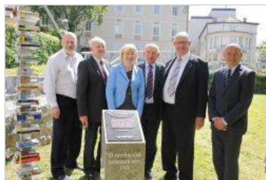
Slovesnosti v Parku Rastoče knjige ob knjižnici so se udeležili tudi predstavniki poljske delegacije in namestnica veleposlanika Poljske.