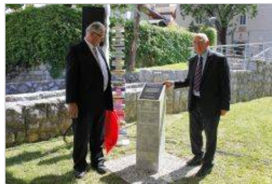
Odkritje spominskega obeležja z naslovno stranjo znamenite Kopernikove knjige je prvi korak projekta Združene Rastoče knjige partnerskih mest Novega mesta.