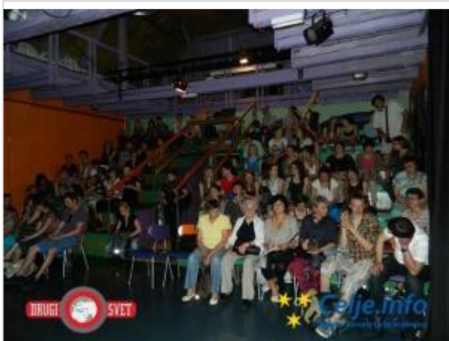
Plesni forum Celje je bil zopet izjemno obiskan.

Kategorija: Kultura • Naslovni modul | 11. jun 2014 ob 20.19 | Komentarji (0)